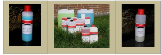
10 Liter KANISTER